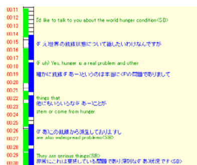
訳出タイミングの分析