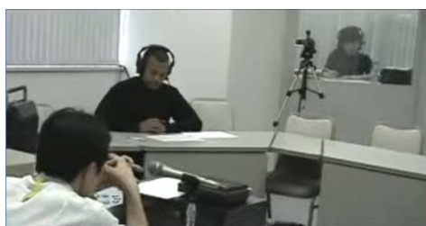
通訳音声の収集状況